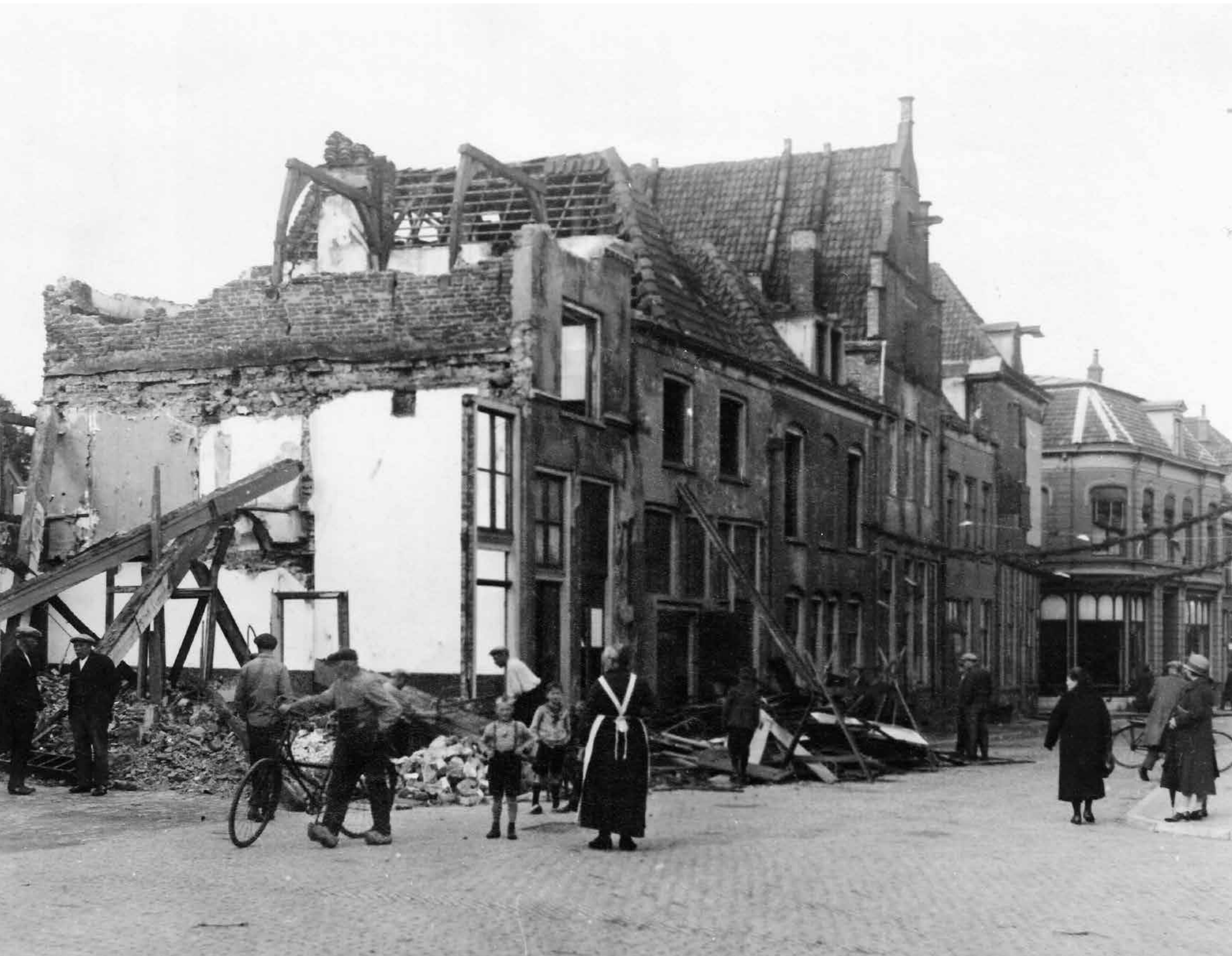
De sloop van panden aan het Noordenbergschild in 1928.